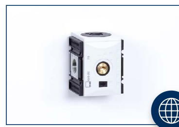
ELOSZTÓK ÉS VISSZACSA PÓK