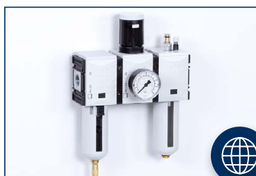
3 RÉSZES EGYSÉGEK