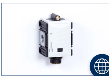
BEKAPCSOLÓ ÉS LÁGYFELTÖLTŐ SZELEPEK