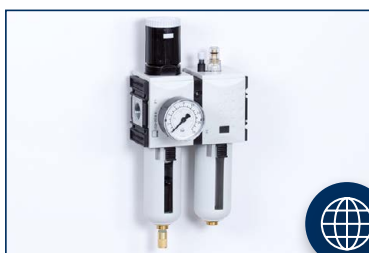
2 RÉSZES EGYSÉGEK